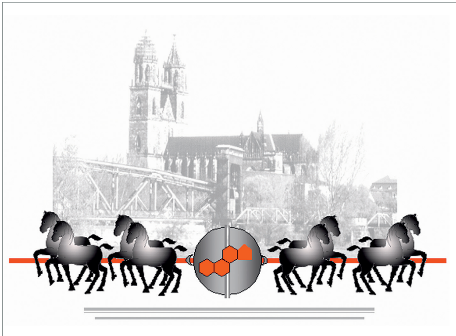
Der Dom zu Magdeburg und der Vakuumversuch Otto von Guerickes

OTTO-VON-GUERICKE-UNIVERSITÄT MAGDEBURG Medizinische Fakultät